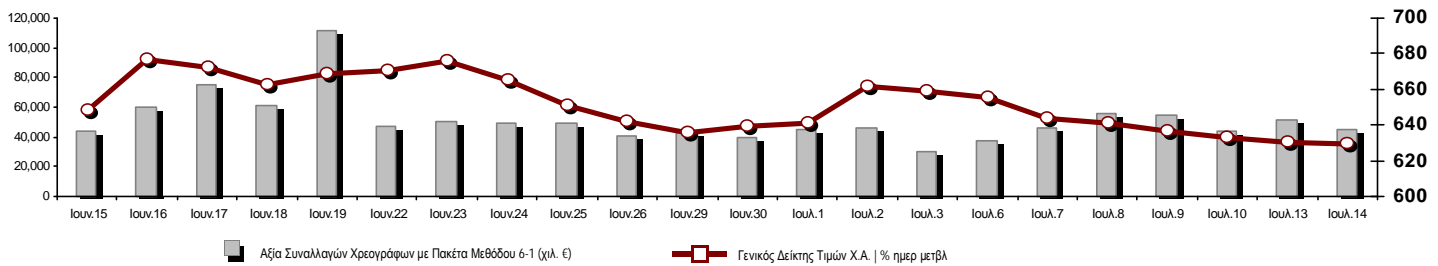
Γενικός Δείκτης Τιμών και Αξία Συναλλαγών Μετοχών και Παραγώγων