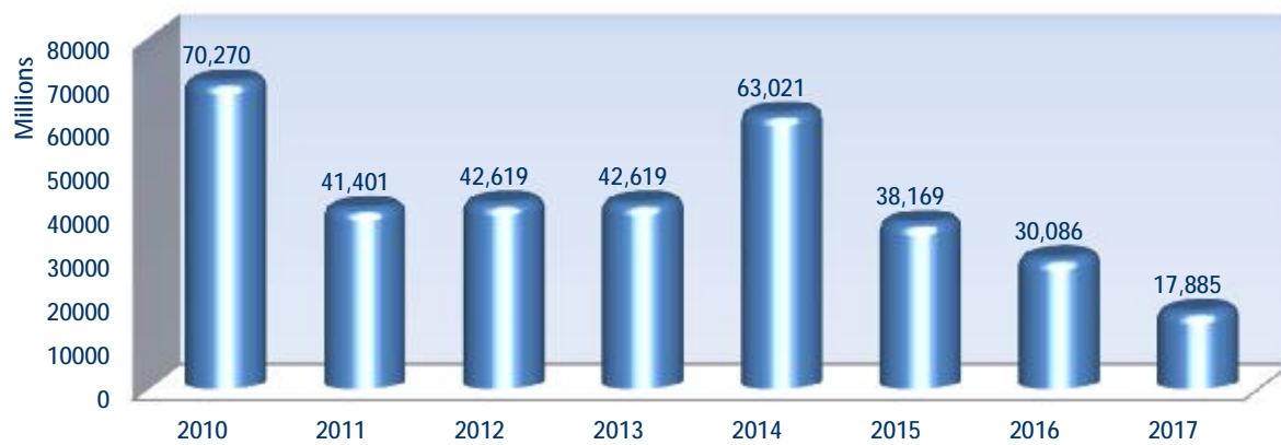
Αξία Συναλλαγών Χρεογράφων ανά έτος (σε εκατ. €)