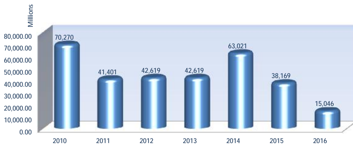
Αξία Συναλλαγών Χρεογράφων ανά έτος (σε εκατ. €)