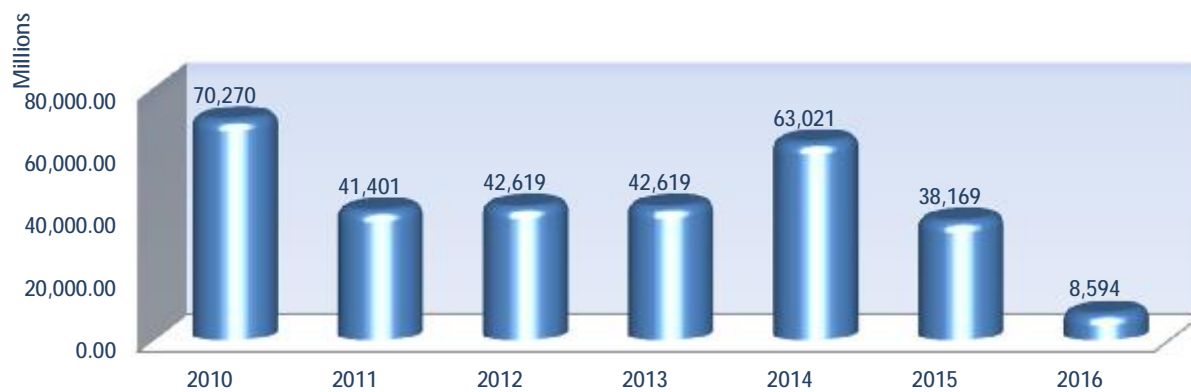
Αξία Συναλλαγών Χρεογράφων ανά έτος (σε εκατ. €)