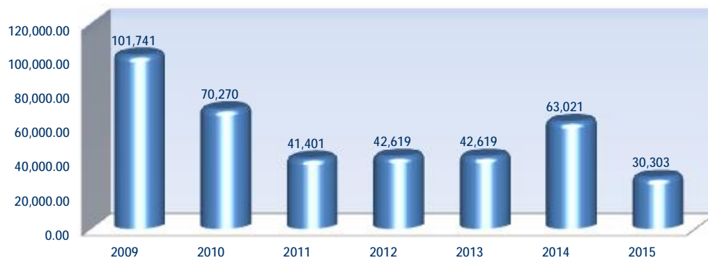
Αξία Συναλλαγών Χρεογράφων ανά έτος (σε εκατ. €)