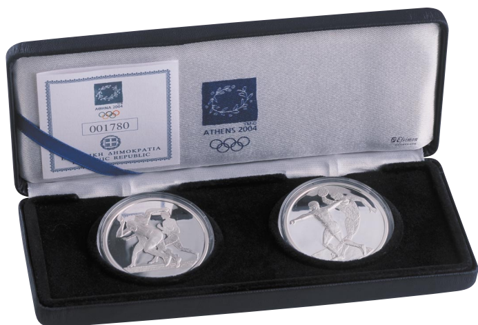
Συλλογή 2 Αργυρών