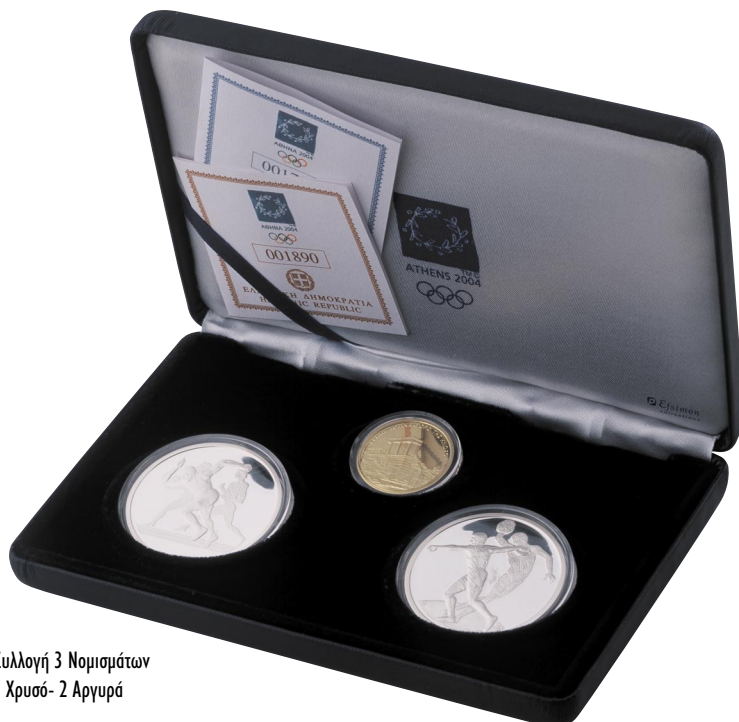
Συλλογή 3 Νομισμάτων 1 Χρυσό- 2 Αργυρά