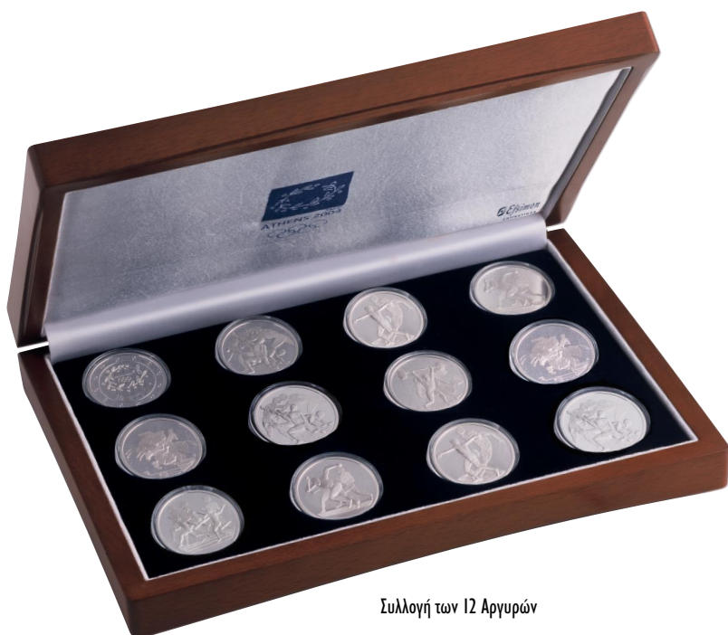
Συλλογή των 12 Αργυρών