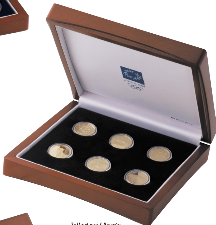
Συλλογή των 6 Χρυσών