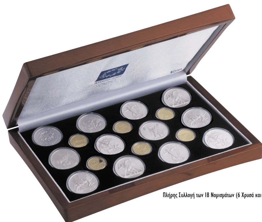
Πλήρης Συλλογή των 18 Νομισμάτων (6 Χρυσά και 12 Αργυρά)